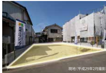
現地(平成29年2月撮影)

ふじみ野駅周辺は大型商業施設やスーパーが充実。暮らしの心地良さにあふれた利便性の高い街です。