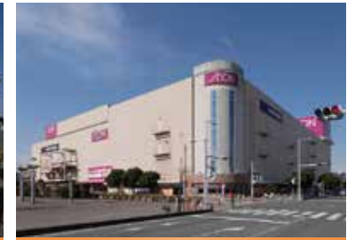
イオン(ふじみ野駅西口より徒歩12分・約900m)