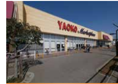
ヤオコー(徒歩17分・約1,360m)

ふじみ野駅周辺は大型商業施設やスーパーが充実。暮らしの心地良さにあふれた利便性の高い街です。